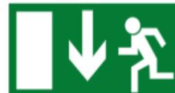
Notausgang (über dem Ausgang anbringen)