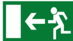
Richtungsangabe für Rettungsweg

Farbe der Schilder grün DIN 4844 Teil 2 Kontrastfarbe für Symbole weiß Randmaße Nach DIN 825 Teil 1 Mindestgröße der Schilder 200 x 400 mm