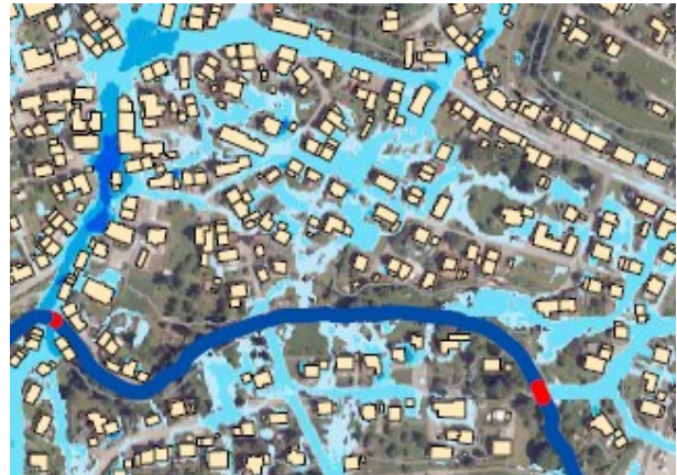
Abb. 7-2: Starkregengefahrenkarte Extrem