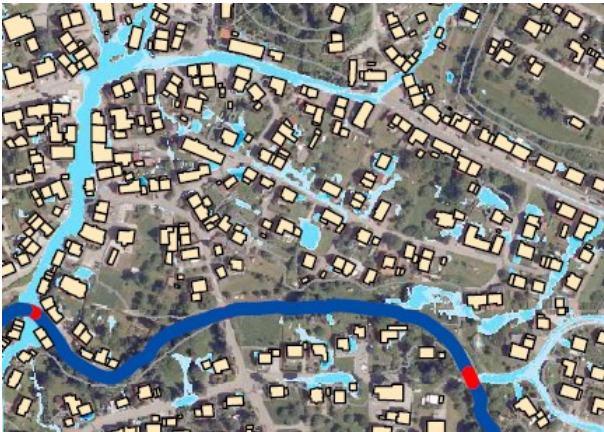
Abb. 7-1: Starkregengefahrenkarte Selten